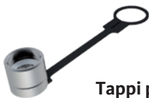
Tappi per MASCHIO