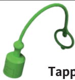
Tappi per MASCHIO