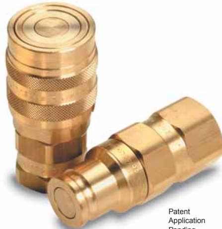
Patent Application Pending